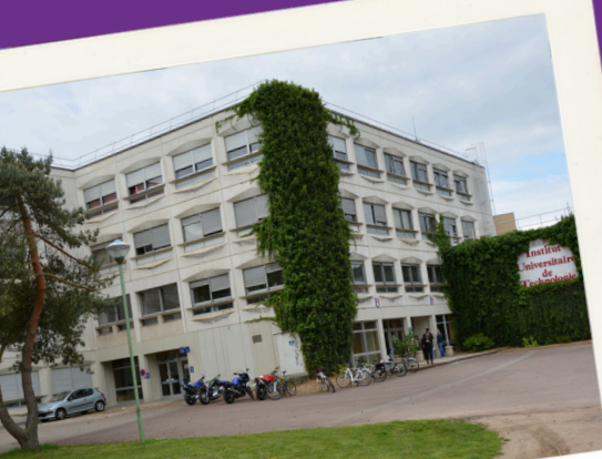
IUT de Metz