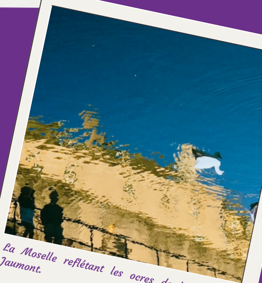
La Moselle reflétant les ocres de la pierre de Jaumont.