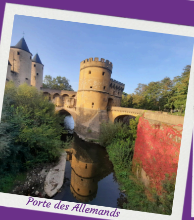
Porte des Allemands