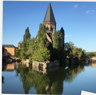
Quai Vauvrin avec vue sur la cathédrale Saint Etienne