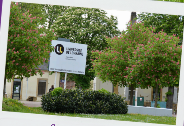
Campus du Sauley