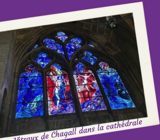
Vitraux de Chagall dans la cathédrale